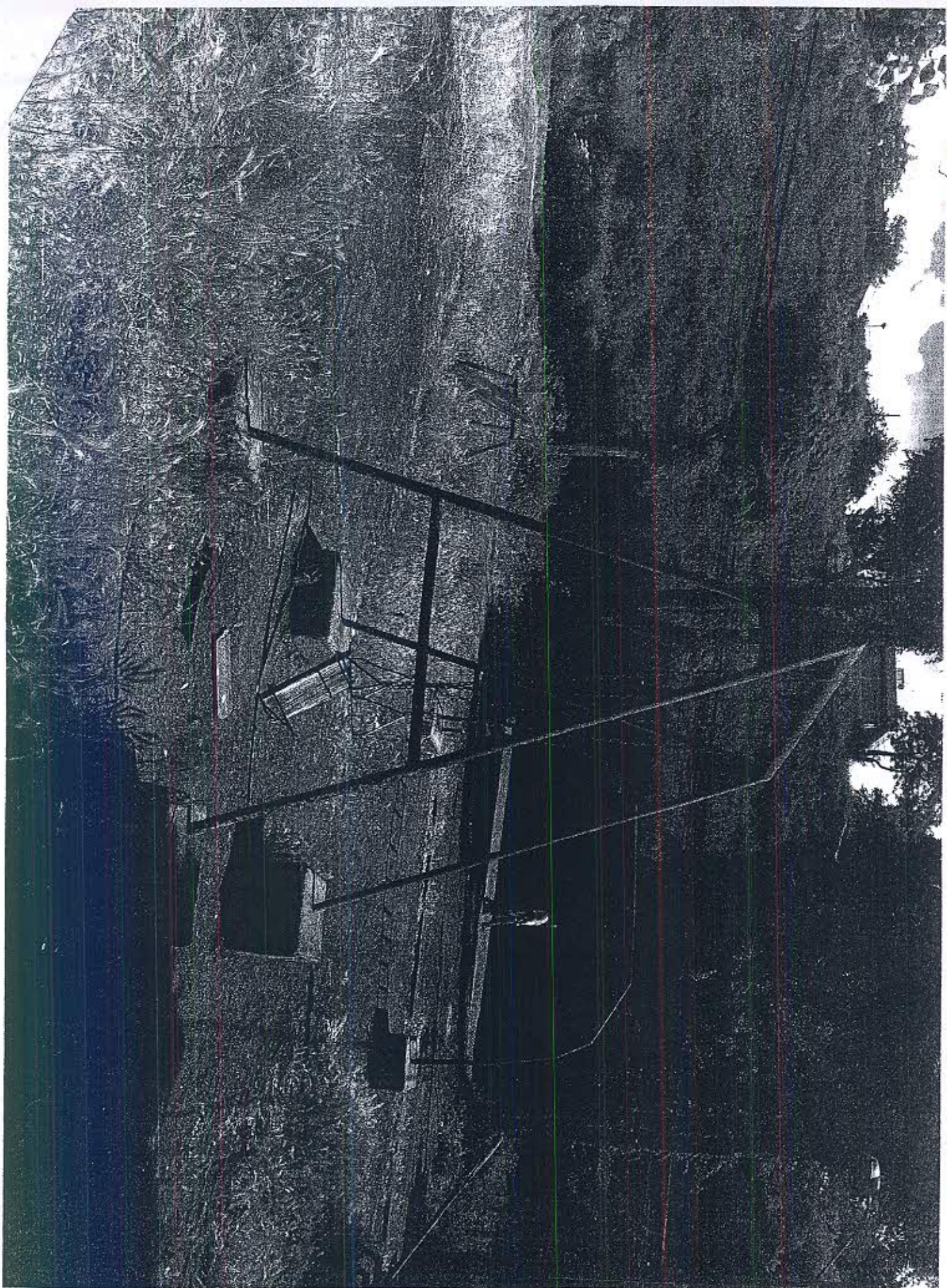
Ypode. Cylneiaeth (Ypode) (10.11.1969) -