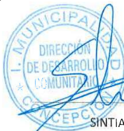
SINTIA LEYTON AEDO