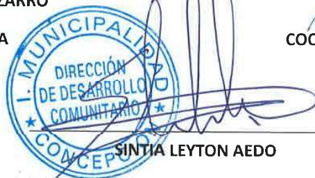
SINTIA LEYTON AEDO