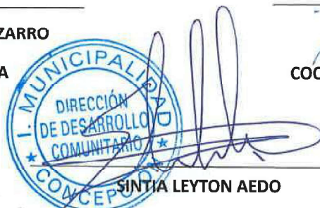
SINTIA LEYTON AEDO