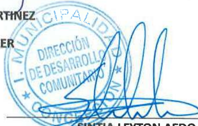
SINTIA LEYTON AEDO