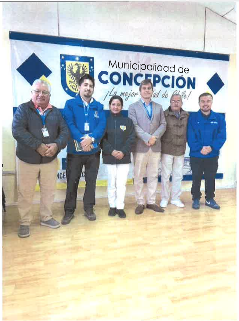
-Articulación con los otros encargados de comunicación de la I. Municipalidad de Concepción