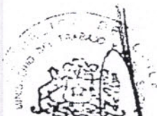
OSVALDO ANDRADE LARA Ministro de Trabajo y Previsión Social